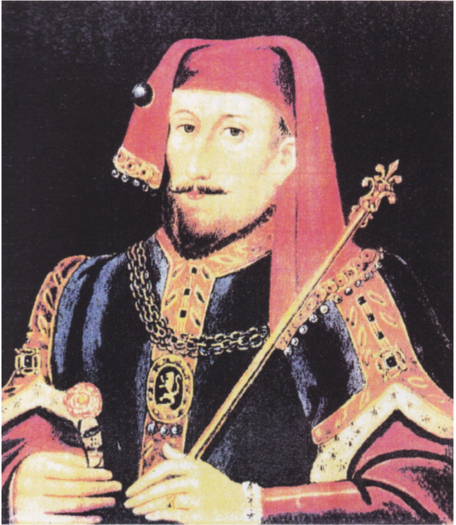
EIN ADLIGER IN DER ROLLE KÖNIG HEINRICHS IV. Kopie eines ursprünglich elisabethanischen Gemäldes